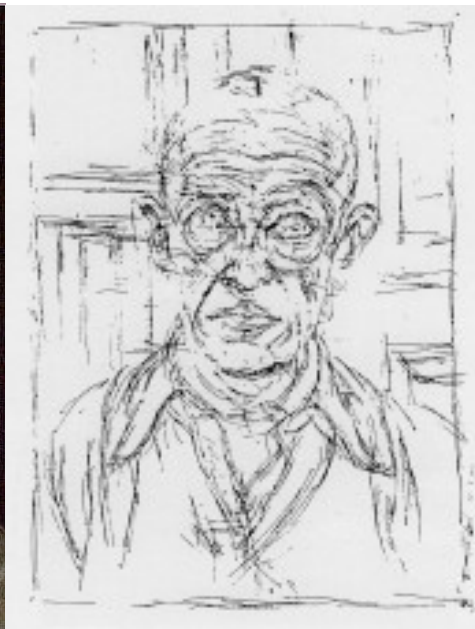
Leiris por Giacometti